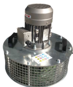
Aspirateur 1,5 ou 2,2 kW 1 aspirateur pour 4 colonnes

Tube Ø 160 ou Ø 200 hauteur 3 m (possibilité d'extension)