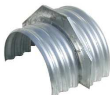
raccord de gaine